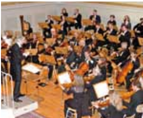
Medizinerorchester Bern |